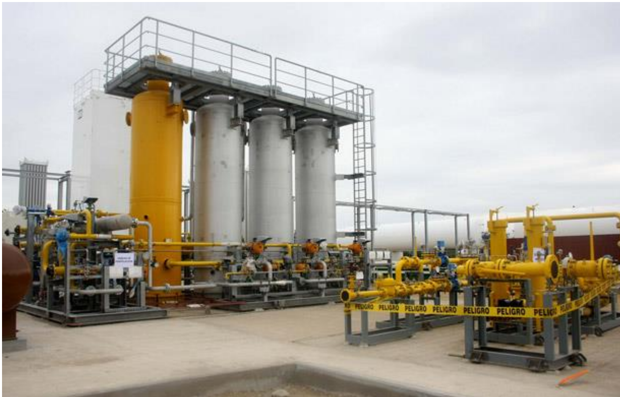
Planta de gas natural Bajo Alto.

En términos pedagógicos se debe entender que Azul es Worley Parsons en Ecuador. Contraloría lo entendió así y por eso en su informe DAPyA-0066-2015, concluyó que “la fiscalización de la remediación civil, es la actividad en la que más trabajó personal de TECNAZUL Cía. Ltda. En el personal utilizado se incluyeron cuatro profesionales de la empresa contratista Worley Parsons International Inc., y siete de TECNAZUL Cía. Ltda.” y añade: “se observó una mayor participación de personal de TECNAZUL Cía. Ltda., destacando que las dos consultoras intervinieron como una asociación en la que participan personal de las dos firmas”.