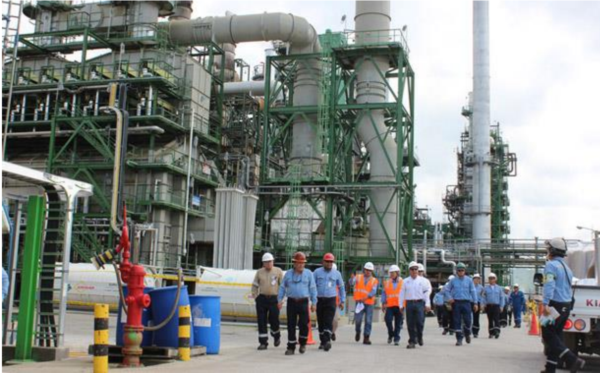
Visita de Focus a la Refinería de Esmeraldas, luego de publicar una serie de denuncias sobre las contrataciones de la repotenciación.